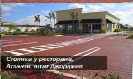
Стоянка у ресторана, Атланте, штат Джорджия