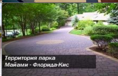
Территория парка Майами - Флорида-Кис

Асфальт-декор предлагает Вам шаблоны для декоративного асфальта эксклюзивных форм, любых цветовых решений и квалифицированные дизайнерские услуги. Возможность ремонта и восстановления покрытия без ущерба для дизайна. Экологично, прочно, быстро, эстетично - новый подход к серому привычному асфальту – Асфальт-декор.