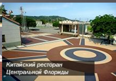
Китайский ресторан Центральной Флориды