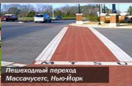
Пешеходный переход Массачусетс, Нью-Йорк