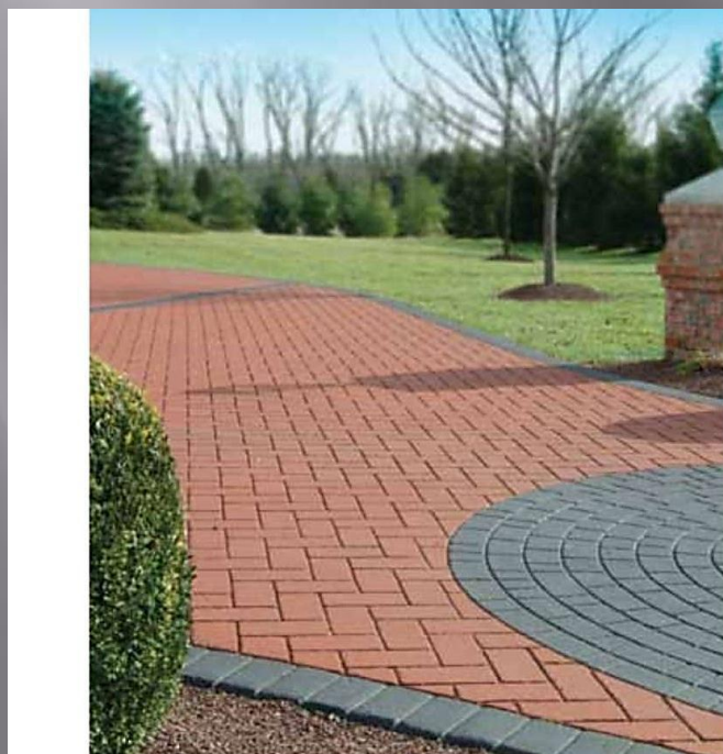
Стандартные цвета покрытий

Возможность создавать с Асфальт-декор уникальные архитектурные ансамбли Реклама на асфальте