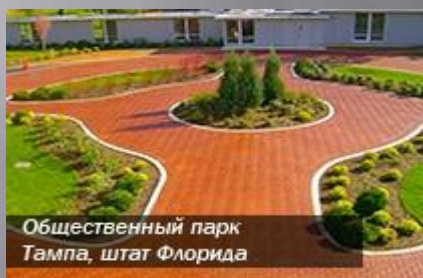
Общественный парк Тампа, штат Флорида

Декоративный дизайн асфальта – перелагаемая нами технология, в процессе которой существующему асфальтобетонному покрытию, как новому, так и требующему ремонта, придается эффект кирпича, сланца, камня и других различных дизайнов. Передовые технологии покрытия, используя технические показатели асфальта (гибкость, силу и пр.), позволяют достичь более длительной эксплуатации поверхностей в сочетании с низкими расходами. Все наши компоненты (от уникального оборудования, нагревающего асфальт, до специальных покрытий) разработаны для решения комплекса задач по декоративному оформлению городского пейзажа и дают неограниченную творческую свободу архитекторам и проектировщикам. Использование декоративного асфальта имеет неоспоримое преимущество в стоимости по сравнению с тротуарной плиткой или камнем.