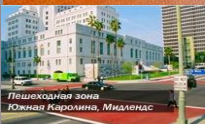
Пешеходная зона Южная Каролина, Мидлендс